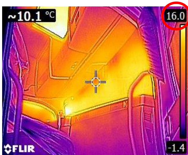
Véhicule avec YZOTRUCK